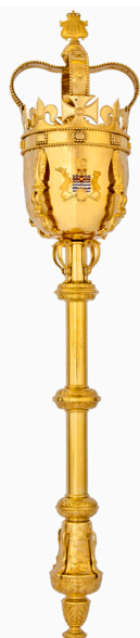
La masse de l'Assemblée législative de la Colombie-Britannique

Le rôle du président fait partie du régime parlementaire britannique depuis 1377. Au début, le président était chargé de transmettre les messages du monarque au Parlement. Avec le temps, son rôle a évolué et il a été chargé de présenter les observations du Parlement au roi ou à la reine. Cette profession pouvait être dangereuse, plusieurs présidents ayant été exécutés pour leur implication dans les affaires politiques du royaume. C'est en raison de ce passé plutôt sanglant et dangereux qu'un président nouvellement élu fait semblant de prendre la place qui lui revient avec réticence et qu'on doit le traîner devant la Chambre de l'Assemblée législative.