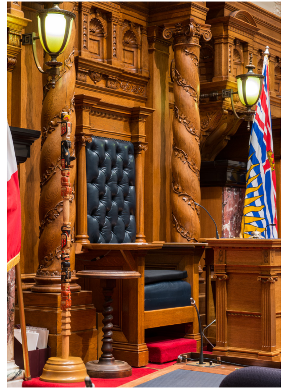
The Speaker's Chair in the Legislative Chamber

To assist the Speaker in maintaining order, MLAs cannot participate in a debate until they are formally recognized by the Speaker. Once recognized, MLAs must direct their speeches or questions to the Speaker, not to each other. Any MLA who disobeys the rules or makes unparliamentary remarks can be disciplined by the Speaker.